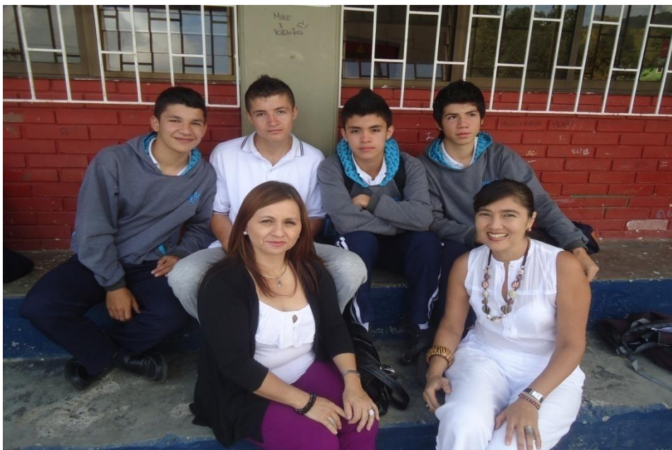
Anexo 2 Durante la charla con los alumnos de la Institución Educativa Héctor Ángel Arcila