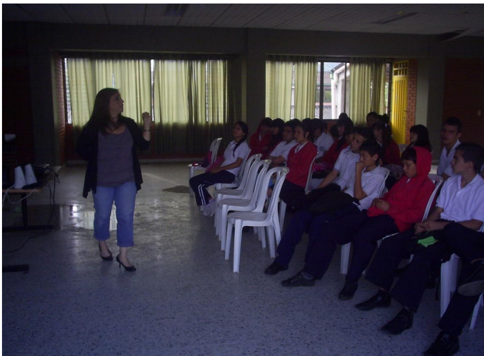
Anexo 3 Presentación Power Point (Hacer doble click )